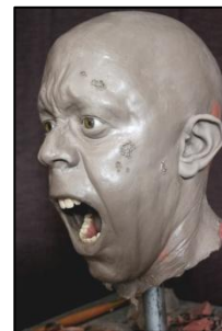
Créations FX Steve