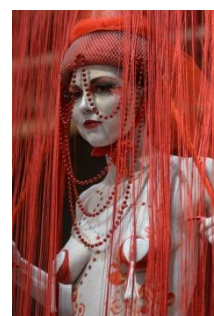
Make up Sandy OLIVA