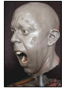
Créations FX Steve